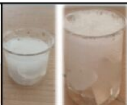
ACIDIFICATION DES OCÉANS