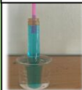
DILATATION DES OCÉANS